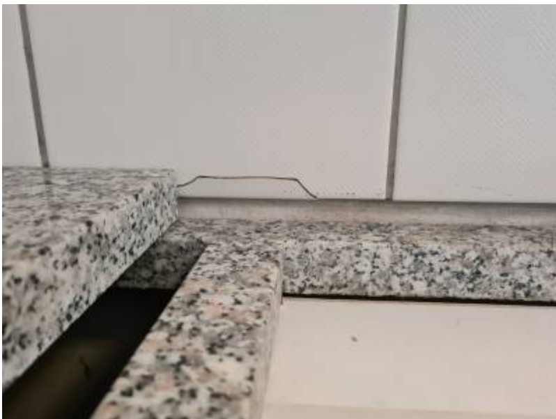
Es wurde eine Lösung gefunden. Ersatz-, oder neue Kacheln gab es nicht mehr. Ein neuer

Durch den Schaden an den Fliesen musste nun auch eine Lösung gefunden und verbaut werden. Natürlich nicht nur bei der defekten Kachel.