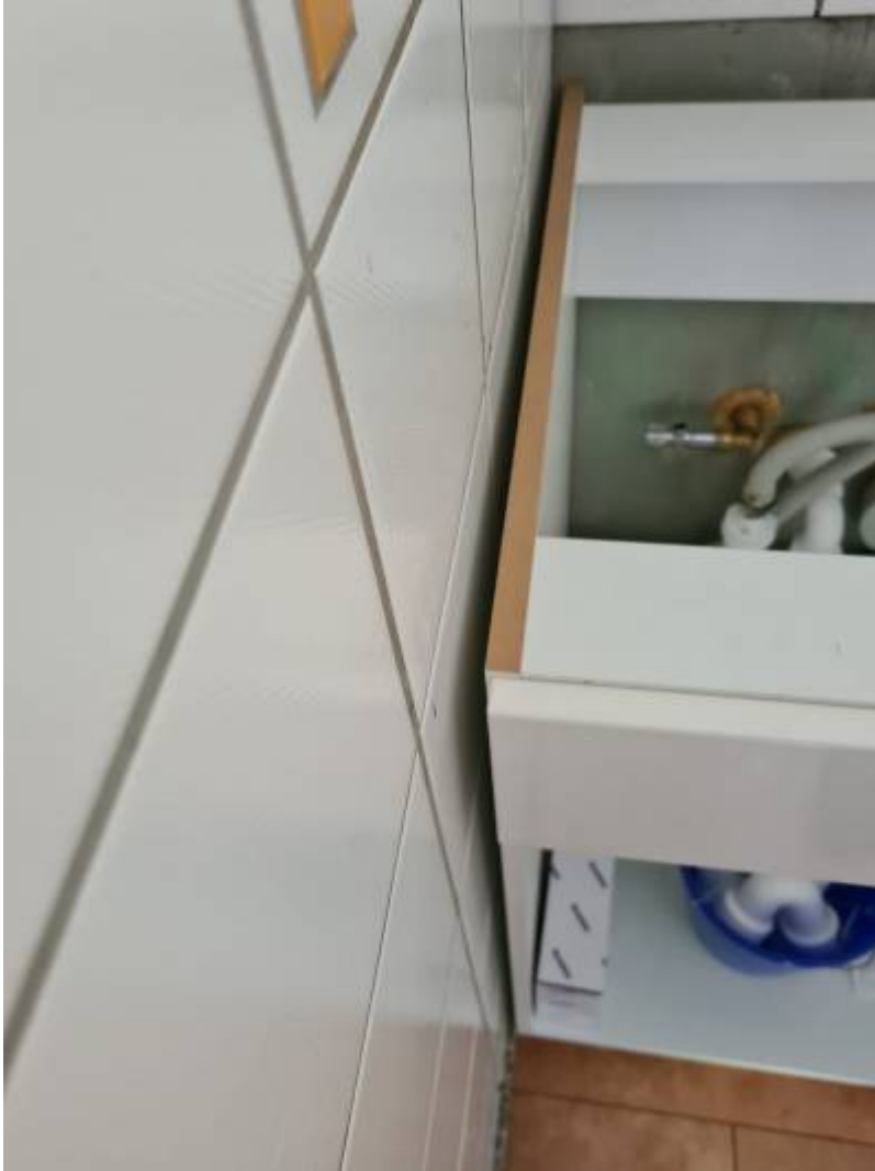
Die Wand steht im richtigem Winkel

Am 23.7.21 Der Steinmetz erstellte nun ein weiteres mal ein Aufmaß da nun die Unterschränke die richtige höhen hatten. Leider passten nun die „Rechten-Wickel“ nicht mehr und die Granitplatte muss erneut zu geschnitten werden.