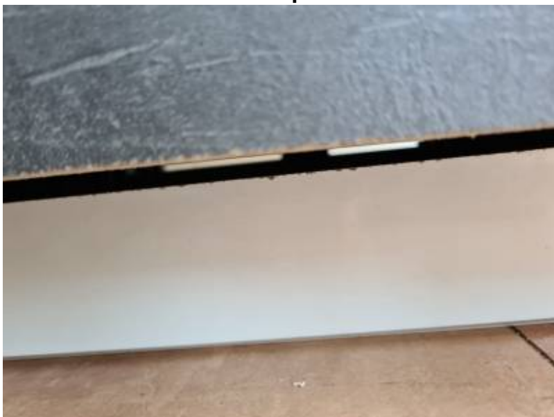
Hier war wohl eine Maus am Zuschnitt: „Ein Bösewicht der sich dabei etwas denkt“. Der KüchenTreff Oberhausen ist ein Teil vom Maus Küchen im Flockenfeld 2; 46049 Oberhausen. : Mann darf den Humor nicht verlieren :

Der Abstand zur Wand ist recht großzügig !