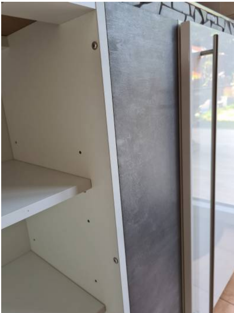
Wie zu sehen ist die Arbeitsplatte wieder einmal unsere Provisorische Lösung.