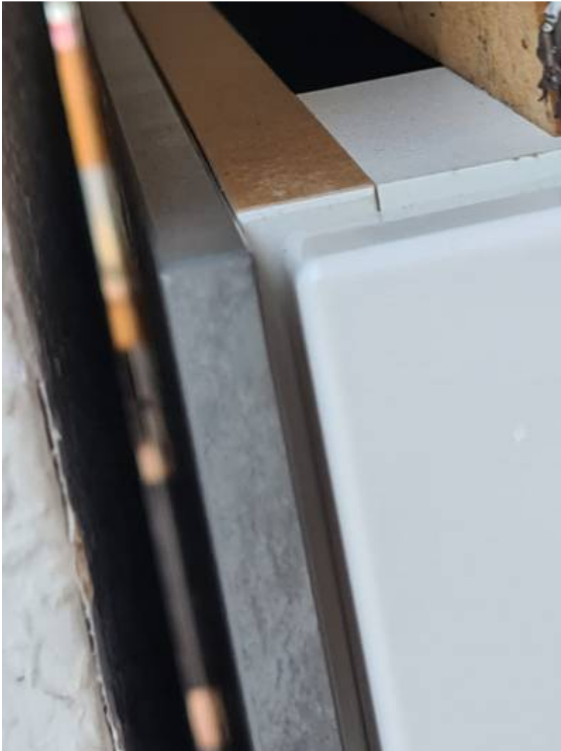
Das Spiel der Dekorwand mit Sicht in den Essbereich zeigt auch großzügige Toleranzen auf.